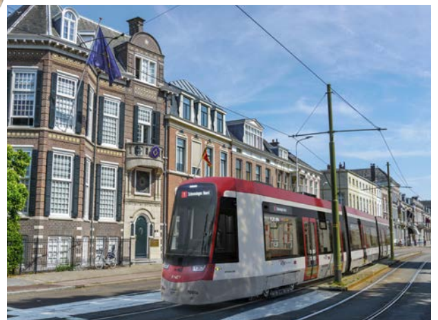
➔ Impressie van de nieuwe, bredere tram.

In de nieuwe remise Scheveningen is straks ruimte voor minimaal 39 brede trams. De bestaande stallingshal wordt gedeeltelijk vernieuwd en de deuren, waar de hal in het verleden mee werd afgesloten, worden teruggebracht conform de huidige milieueisen voor energie en geluid. Ook wordt de bestaande bouw (kantoren etc.) meegenomen in de renovatie. Tijdens de verbouwingsperiode wordt de remise niet gebruikt. Daarnaast worden de sporen op het voorterrein en de in- en uitruksporen in de Harstenhoekstraat vervangen. Omdat de trams daar dicht op de huizen voorbij komen, geldt daar al jaren een snelheidsbeperking. Maar dan nog ontvangen we daar soms klachten over overlast. Daarom gaan we de manier waarop ze in de straat liggen, aanpassen op