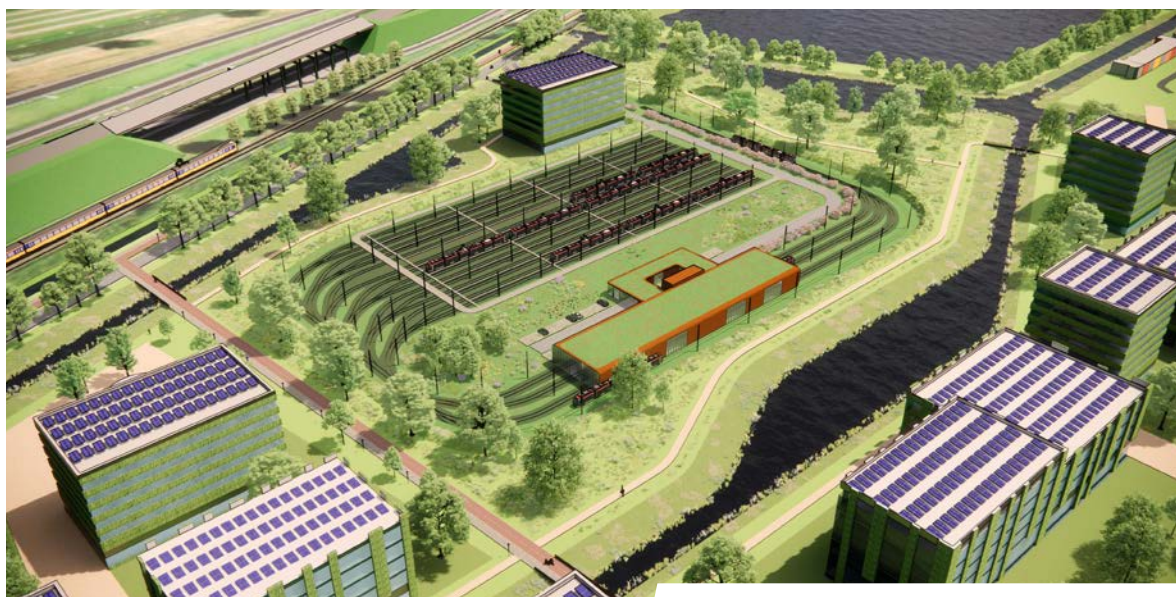
➔ Impresie van remise Guldenpad, nabij het Prins Clausplein.

Eén van de belangrijkste zaken die voor die tijd geregeld moet zijn, is de stalling van de nieuwe trams. HTM is samen met de gemeente Den Haag bezig om de remise Guldenpad te realiseren op het terrein naast het Prins Clausplein, op het grensgebied van Den Haag Ypenburg en Nootdorp. De voorbereidingen zijn in volle gang. Deze nieuwe remise biedt echter niet voldoende ruimte voor al onze trams.