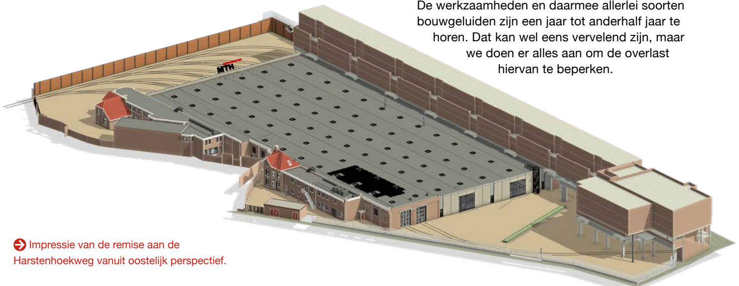
➔ Impressie van de remise aan de Harstenhoekweg vanuit oostelijk perspectief.

De werkzaamheden en daarmee allerlei soorten bouwgeluiden zijn een jaar tot anderhalf jaar te horen. Dat kan wel eens vervelend zijn, maar we doen er alles aan om de overlast hiervan te beperken.